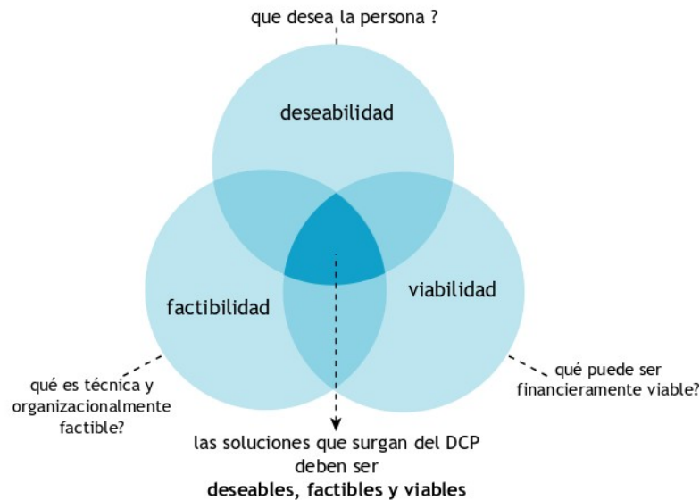
Fig. 2. Lupas del DCP. Kit de herramientas, IDEO.

El proceso DCP que tomamos como metodología hace foco en tres aspectos esenciales: . deseabilidad . escuchar y entender lo que las personas desean y necesitan . factibilidad . que la propuesta desarrollada sea posible de ser realizada en nuestro medio, con tecnologías y materiales disponibles y accesibles . viabilidad . que la solución sea posible de realizar con los recursos económicos disponibles.