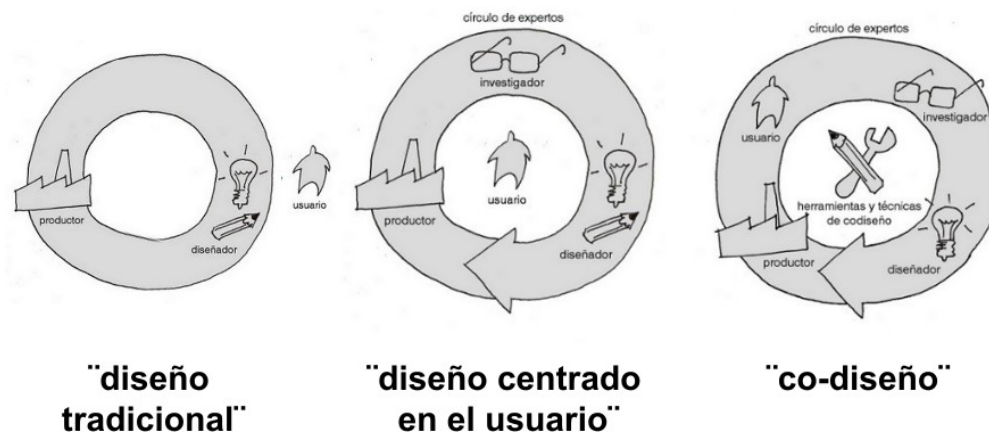
Fig 1. El rol del diseñador en relación al usuario. http://lonjausdesign.com/co-diseno01/

Los proyectos se abordan desde el codiseño como modalidad de trabajo cuyo eje central es colocar a las personas/usuarios/clientes no en el centro, como objeto de estudio y análisis, sino como participantes activos del proceso de diseño, integrando el “círculo de expertos”. El diseñador actúa entonces como un facilitador de herramientas (creativas y de análisis) que permitirán que el “usuario” tome parte activa en el proyecto a desarrollar. (fig. 1)